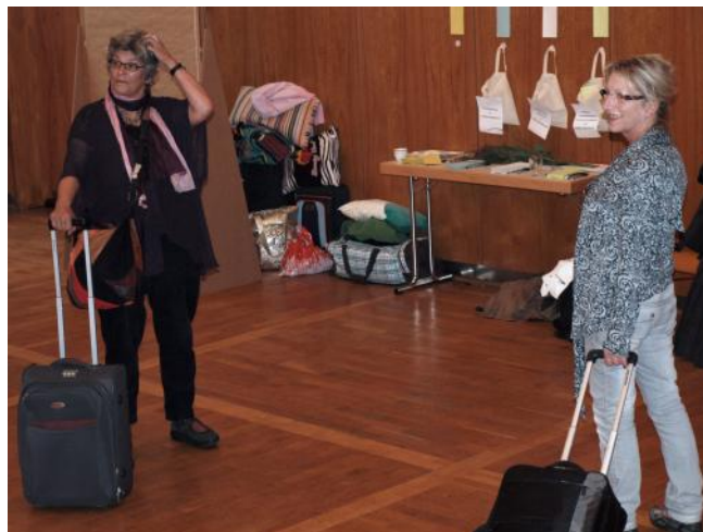
(Bericht: Karen Nitschke)

Eines haben sie alle gemeinsam: Sie haben sich gemäß dem Sprichwort frei nach Max Reinhard „ihre Kindheit heimlich in die Tasche gesteckt und machen sich nun auf und davon, um bis an ihr Lebensende weiterzuspielen.“ Als ausgebildete bka-Spiel- und Theatertrainer und -pädagoginnen bereichern sie zukünftig nicht nur die Kinder- und Jugendarbeit, das Gemeinwesen, die Kirchengemeinden, begeistern Schüler und Senioren etc. Sie machen auch das Leben ein bisschen bunter, das Herz in der Hand und das professionelle Rüstzeug in der Tasche.